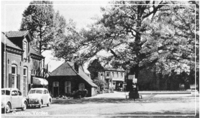
Het oude centrum van Vorden met op de achtergrond het oude GTW-kantoor, nu 'Klein Kranenberg Meubelen'.

In 1939 is de tramdienst opgeheven. De rails werden opgebroken. Aan de