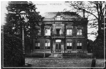
Het notarishuis aan de Zutphenseweg, op de plaats waar nu de Rabo-bank is. Deze opname dateert van omstreeks 1910.

maar voegde hieraan meteen toe: "maar ik mag hem wel". Hoger lof was uit die mond nauwelijks denkbaar.