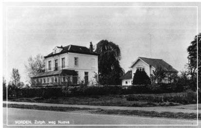
'Villa Nuova' omstreeks 1965, nadat er een serre aangebouwd was.