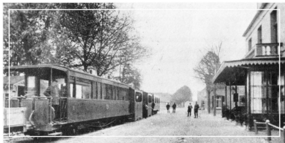
Personentram in de Dorpsstraat ter hoogte van hotel Ensink (thans hotel Bakker). Deze opname dateert vermoedelijk van omstreeks 1930.

Tot in de jaren '30 van deze eeuw was de tram in onze omgeving een openbaar vervoermiddel dat zich met een matig vaartje 'langs 's Heren wegen spoedde'. Dat was al begonnen in het jaar 1903 en de exploitatie van de tramwegen berustte bij de maatschappij 'De Graafschap'. Later werd dat 'De Gelderse Tramweg Maatschappij'. Het centrale punt van het tramgebeuren lag aanvankelijk bij hotel Ensink (nu hotel Bakker). Later werd dat verplaatst naar het pand van de familie Pasman, aan de Kerkstraat. Daarin kwam ook een wachtkamer voor de tramreizigers. Een bekende chef in dat tramstation was de heer Beltman. Hij droeg een pet met een rode band als teken van zijn waardigheid. Met een fluitsignaal gaf hij de trams toestemming om te vertrekken.