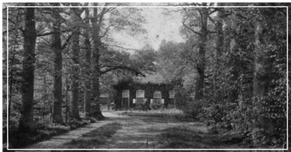
't Schoolhuis', in de Wildenborch, zoals dat er aan het begin van deze eeuw, omstreeks 1905, uitzag.