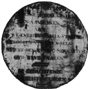
Metalen herinneringsplaquette van de school die A.C.W. Staring in 1797 stichtte in de Wildenborch.