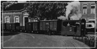
Goederentram in het centrum van Vorden. Op de achtergrond het oude gemeentehuis en het oude postkantoor, thans, respectievelijk, het dorpscentrum en De Tuunte.

Bijenhof, die ook wel wist hoe je met paarden moest omgaan, zelf moest zorgen voor het inspannen en begeleiden ervan.