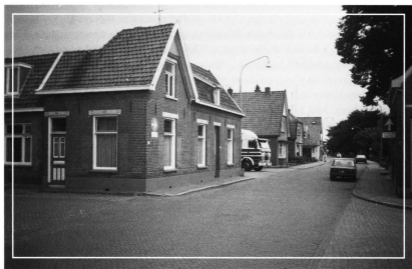
Het voormalige woonhuis, later kantoor, van transportbedrijf 'Woltering', voordat het in 1988 gesloopt werd.

In het boek Vorden, een historische verkenning , uitgegeven door de Oudheidkundige Vereniging 'Oud Vorden', passeren in het hoofdstuk gewijd aan handel en industrie diverse bedrijven de revue die in Vorden zijn, of waren gevestigd. Mede omdat in het kader van dit boek slechts de belangrijkste bedrijven konden worden belicht, is lang niet alle bedrijvigheid in ons dorp aan de orde gekomen. Zo werd in dat hoofdstuk niet expliciet aandacht besteed aan transportbedrijf Woltering , van Kobus Woltering. Toch betreft het, zeker de laatste decennia, een bedrijf van enige omvang, dat al meer dan 60 jaar bestaat en dat is gegroeid uit een eenvoudige tak van bedrijvigheid: het houtslepen met paarden. Het mag zeker ook gerekend worden tot de bedrijven die de naam van ons dorpje Vorden in heel Europa bekendheid hebben verschaft.