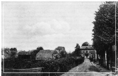
Zicht op het notarishuis vanuit de Schoolstraat (later Smidsstraat). Daar stond toen de ulo-school. Deze opname is waarschijnlijk gemaakt omstreeks 1905.

Waar gewerkt wordt, gaat er wel eens iets mis of bijna mis. Zo vernam ik bij overlevering dat zich bij notaris Numans het geval schijnt te hebben voorgedaan van een erflater die alleen verre neven en nichten naliet, waaronder iemand die naar zeggen van de familie jaren geleden naar Duitsland was vertrokken en sindsdien geen teken van leven meer zou hebben gegeven; niemand wist zijn adres. De notaris, voorzichtig, treuzelde zo lang mogelijk met de boedelscheiding, maar toen men lastig werd, moest hij deze wel passeren, waarbij hij ervan uitging alsof